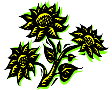
Helianthus Annuus: Sunflower

blooms in the summer time. Its colors are vibrant, happy and majestic and its name comes from always turning towards the sun. What a similarity between us and this common herb of the world. It relies on the sun as we rely on our God. It soaks up the warmth of the sun just as we look for God to entrust him with our lives, so we can hand out the hope and comfort of turning to Father, Son