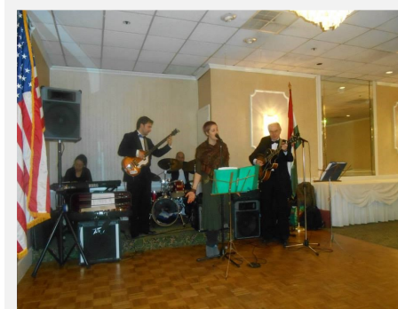
Református Egyház Calvin termében lesz megtartva, 2014. November 8,-án.

ösztöndíjra pályázó diák. Az 55. Magyar Protestáns Bál idén a Passaic Magyar